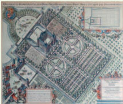
Hof te Honsholderdijk afb. van Balthasar Florisz. van Berckenrode 17 e eeuw.

In de 200 jaar van zijn bestaan ging het slot vele malen over in andere handen en gaandeweg verdween de glorie. Het had in zijn nadagen verschillende bestemmingen, zoals een cadettenschool, maar kende ook jaren van leegstand en verval. Tot begin negentiende eeuw definitief het doek viel en de gebouwen werden gesloopt.