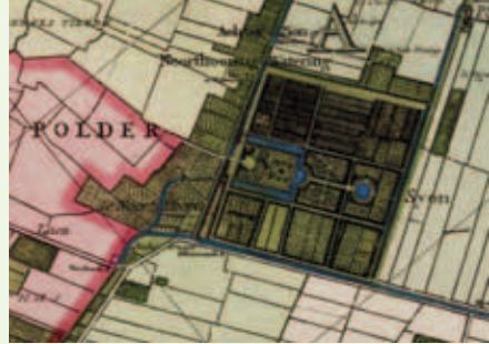
Sion op de kaart van Kruikius uit 1712.

waar groen en duurzaam wonen centraal staat. De naam verwijst rechtstreeks naar de moestuinen van buitenplaats Sion. Met warmoes werd vroeger bladgroente in het algemeen aangeduid, vooral in bereide toestand; er wordt ook snijbiet mee bedoeld.